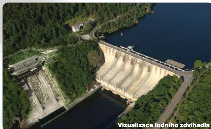
Vizualizace lodního zdvihadla