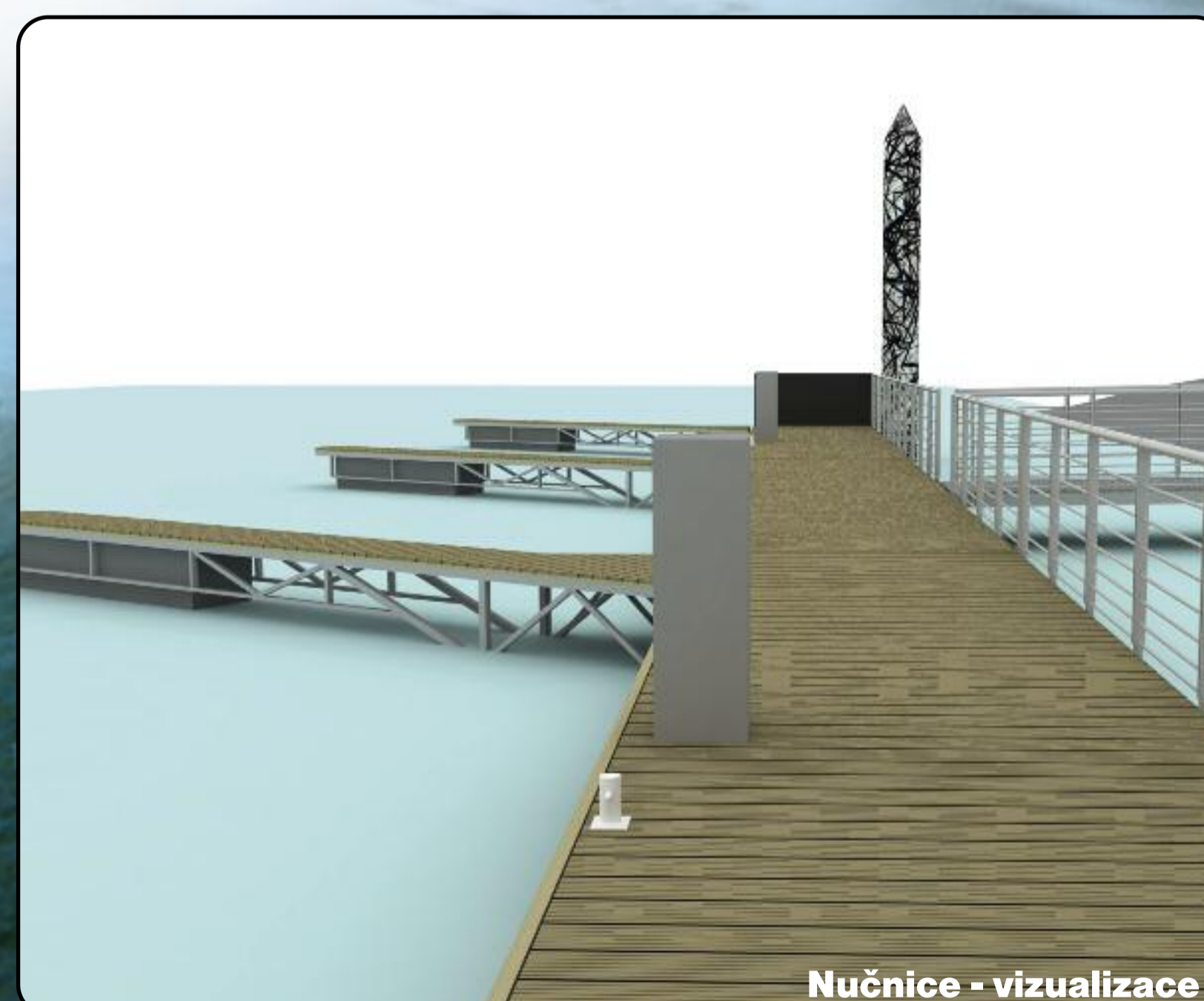
Nučnice - vizualizace