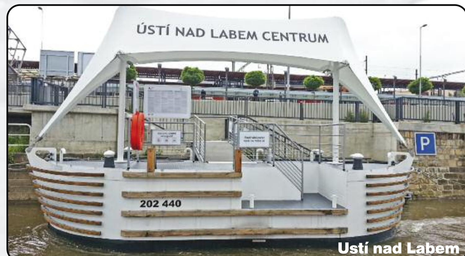
Ústí nad Labem

Připojení plavidel na elektrickou energii