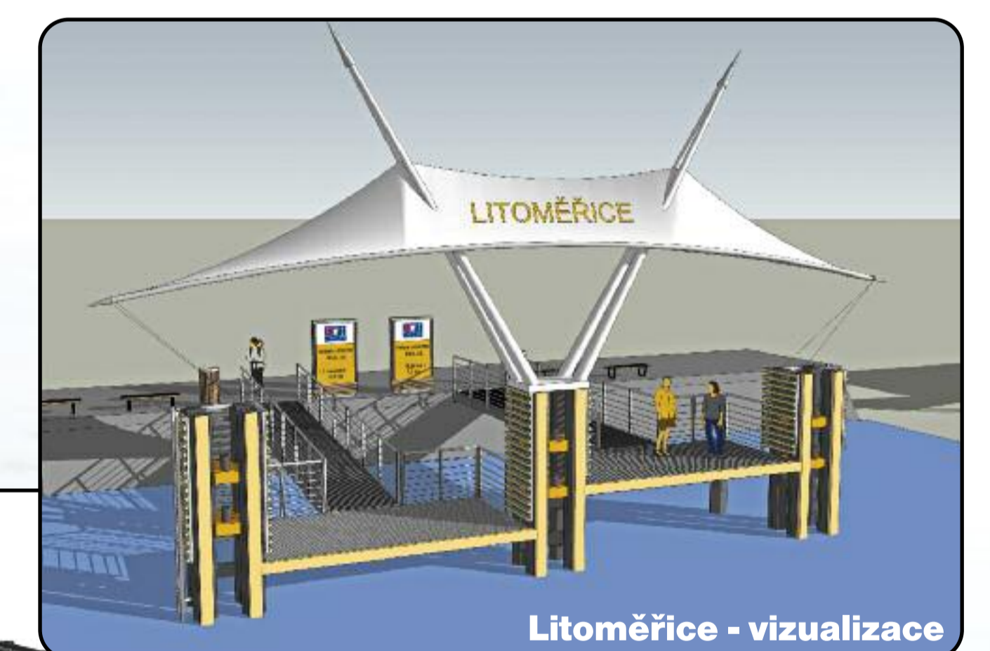
Litoměřice - vizualizace