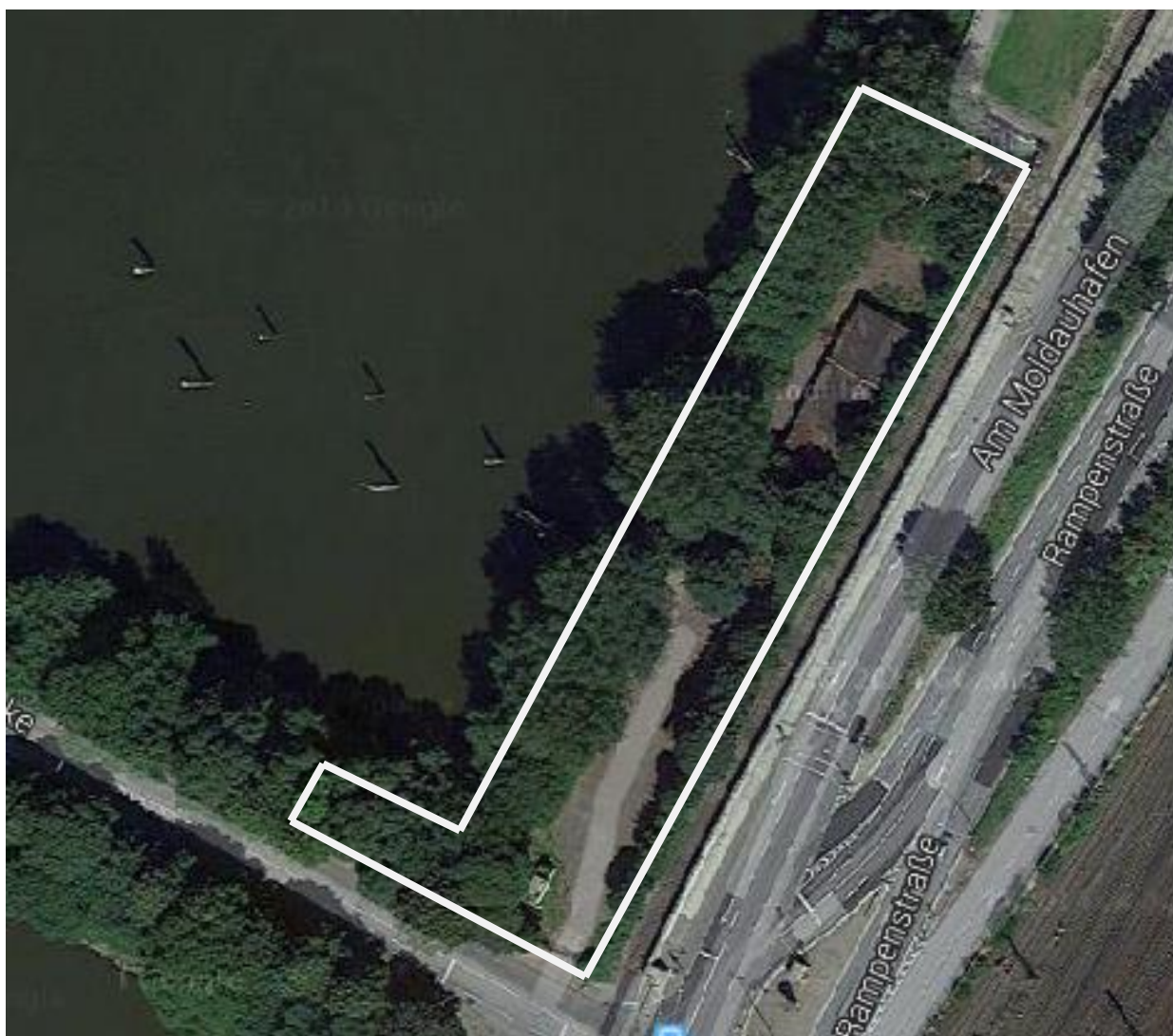
Vyznačení pronajatého území v Moldauhafen – mapový podklad Google