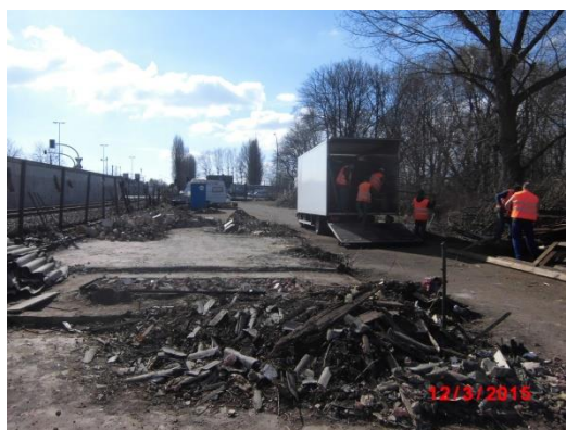
probíhající práce v 032015

Sledování vyhlášených zakázek a jejich výsledků, které se týkají spravovaného území v Hamburku, je možné sledovat na profilu zadavatele – Ředitelství vodních cest ČR: