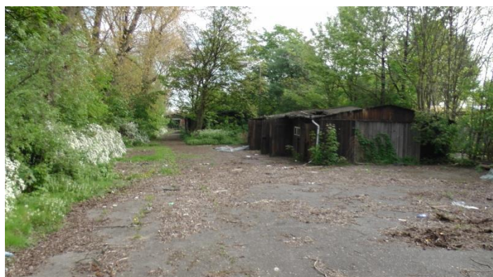
Stav v 042014