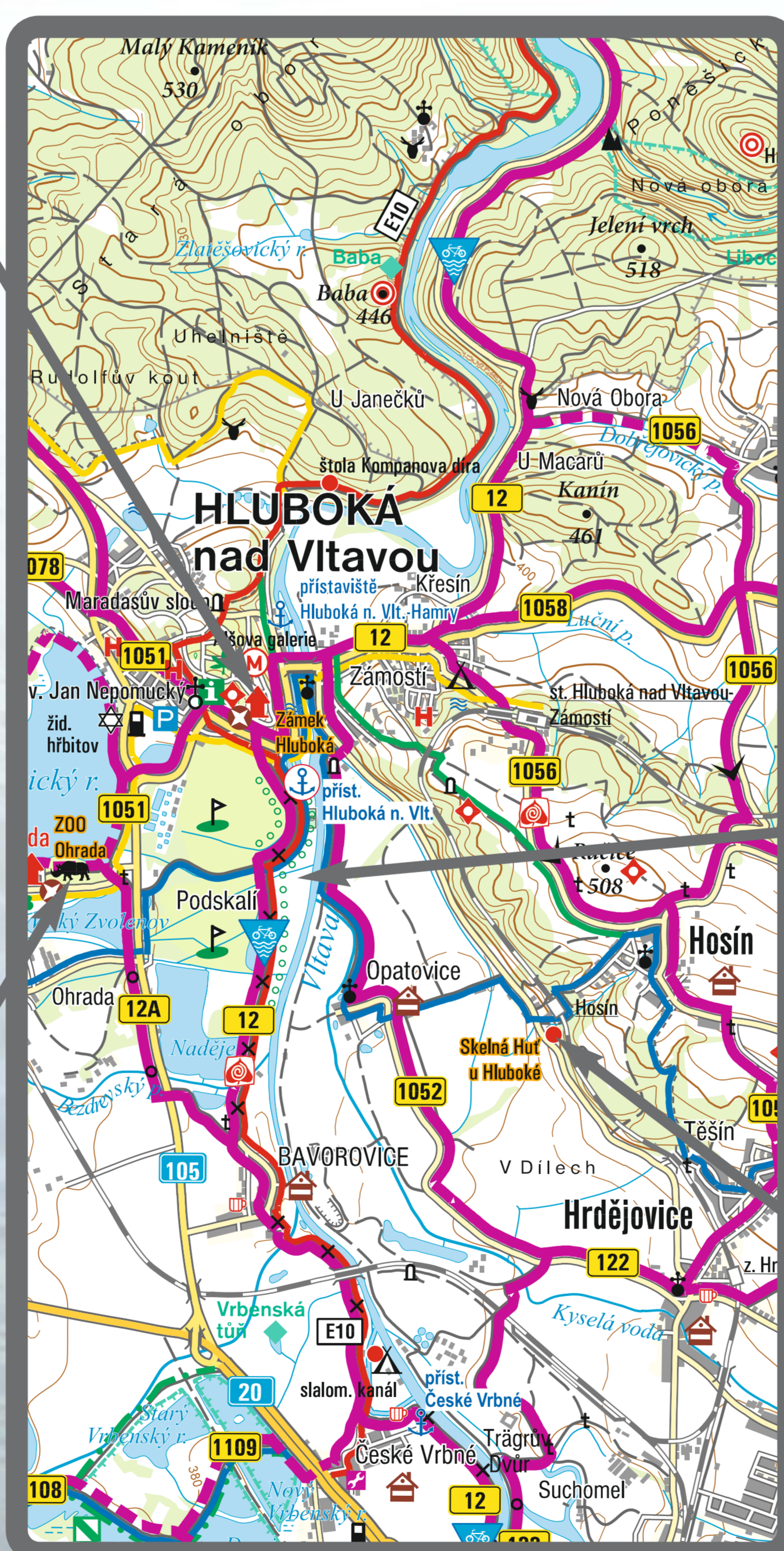
mapová část © Kartografie PRAHA, a. s.

Aktuální informace Aktuelle Informationen / Current information www.rvccr.cz