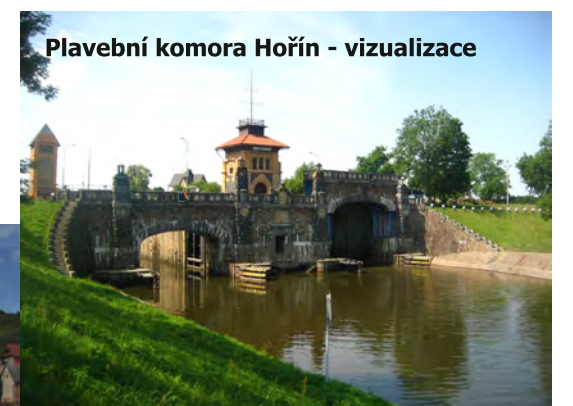
Plavební komora Hořín - vizualizace