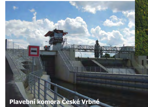
Plavební komora České Vrbné