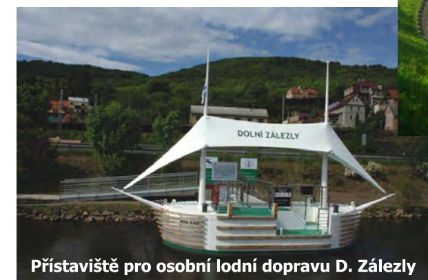
Přístaviště pro osobní lodní dopravu D. Zálezly