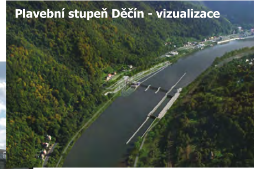
Plavební stupeň Děčín - vizualizace