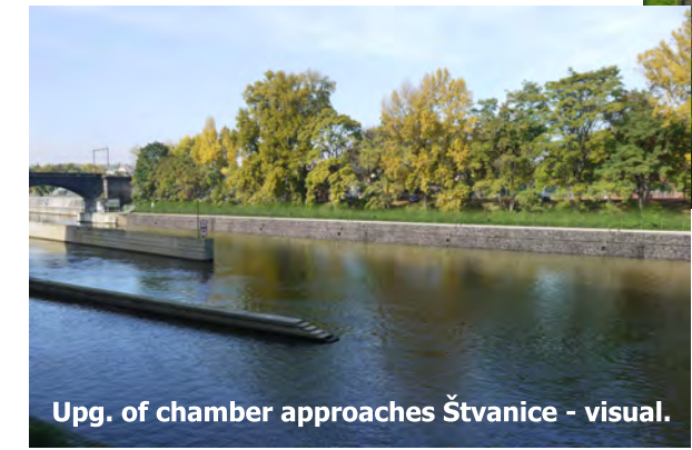
Upg. of chamber approaches Štvanice - visual.