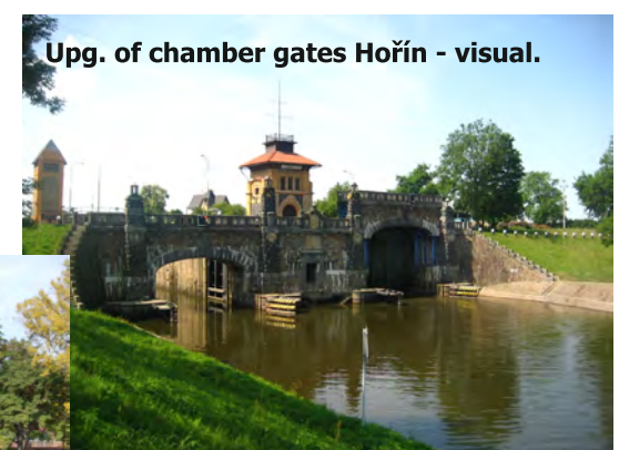
Upg. of chamber gates Hořín - visual.