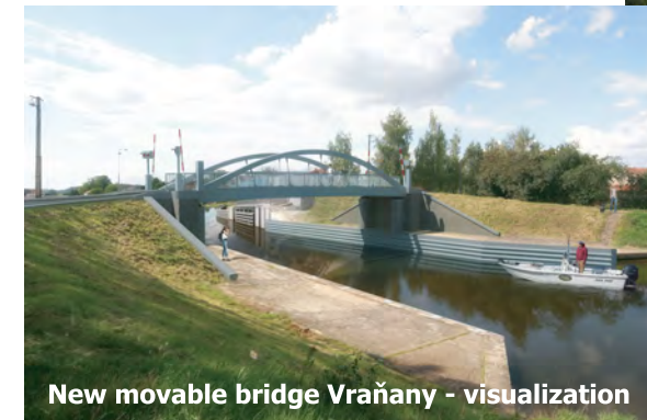
New movable bridge Vraňany - visualization