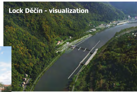
Lock Děčín - visualization